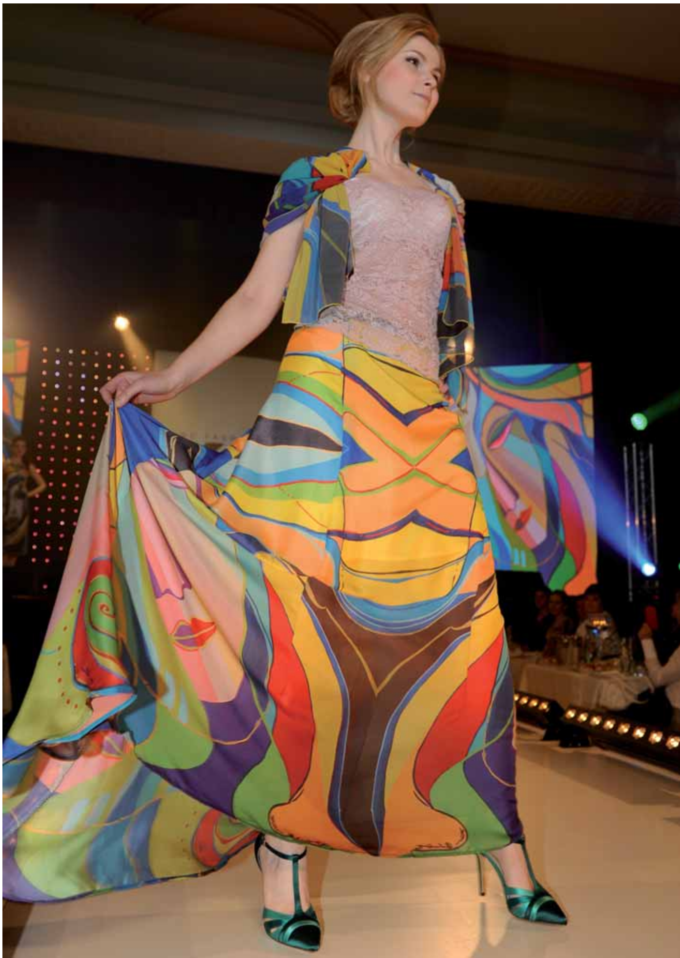
Barevná láska - dlouhá sukně s vlečkou, top, šála - módní přehlídka Trenčianske Teplice, duben 2015