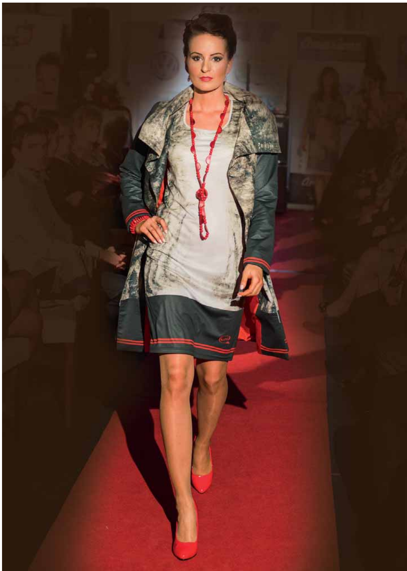
Les Keltů - šaty a kabát - módní přehlídka Bratislava, leden 2015