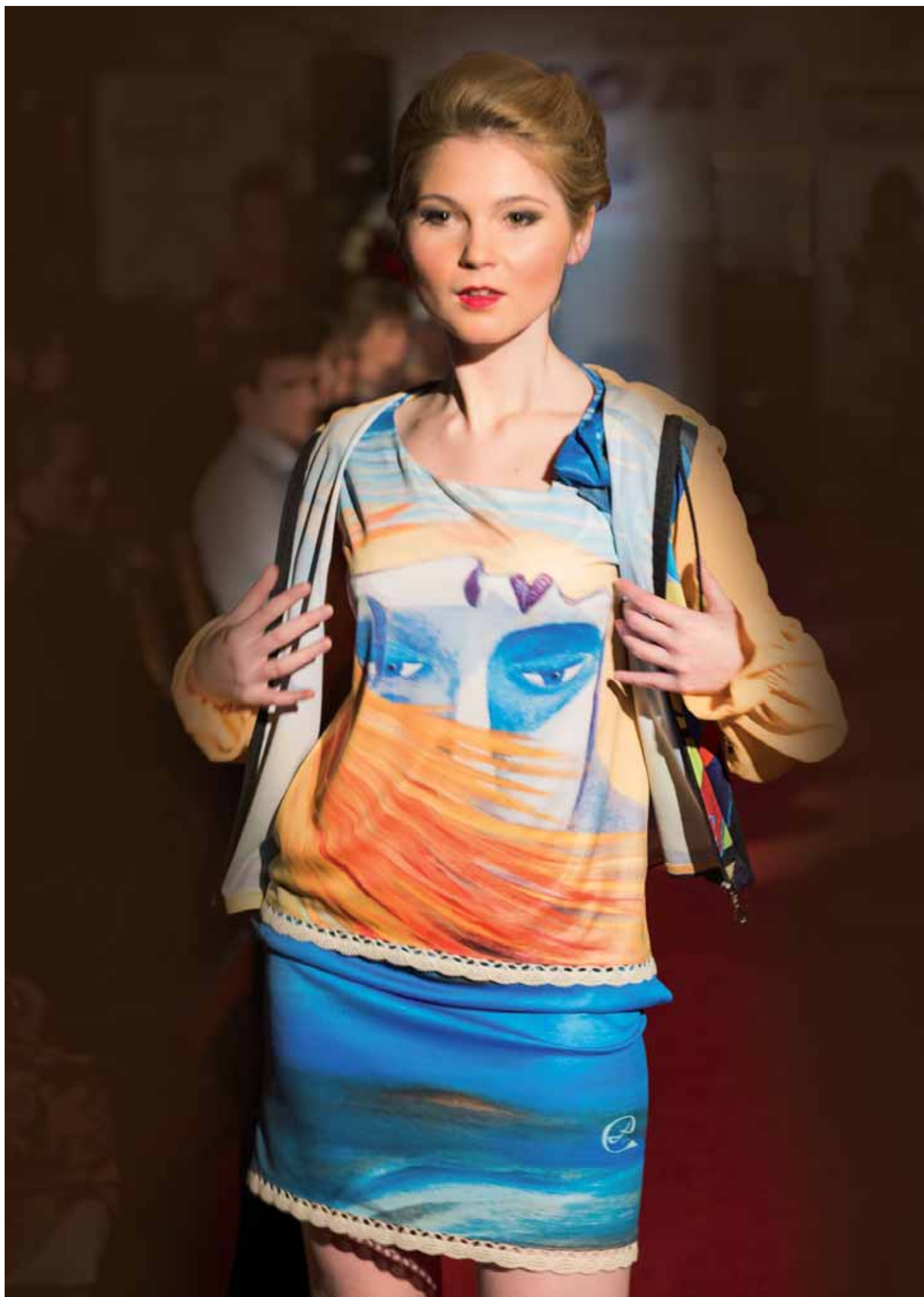
Dvě v jedné - top a sukně - módní přehlídka Bratislava, leden 2015