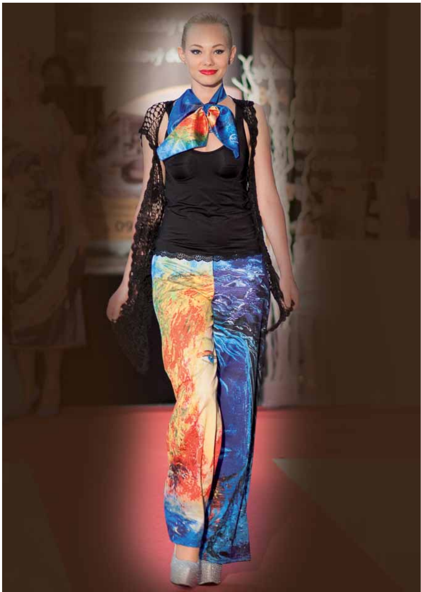
Den a Noc - kalhoty a šátek - módní přehlídka Zámek Víglaš, květen 2015