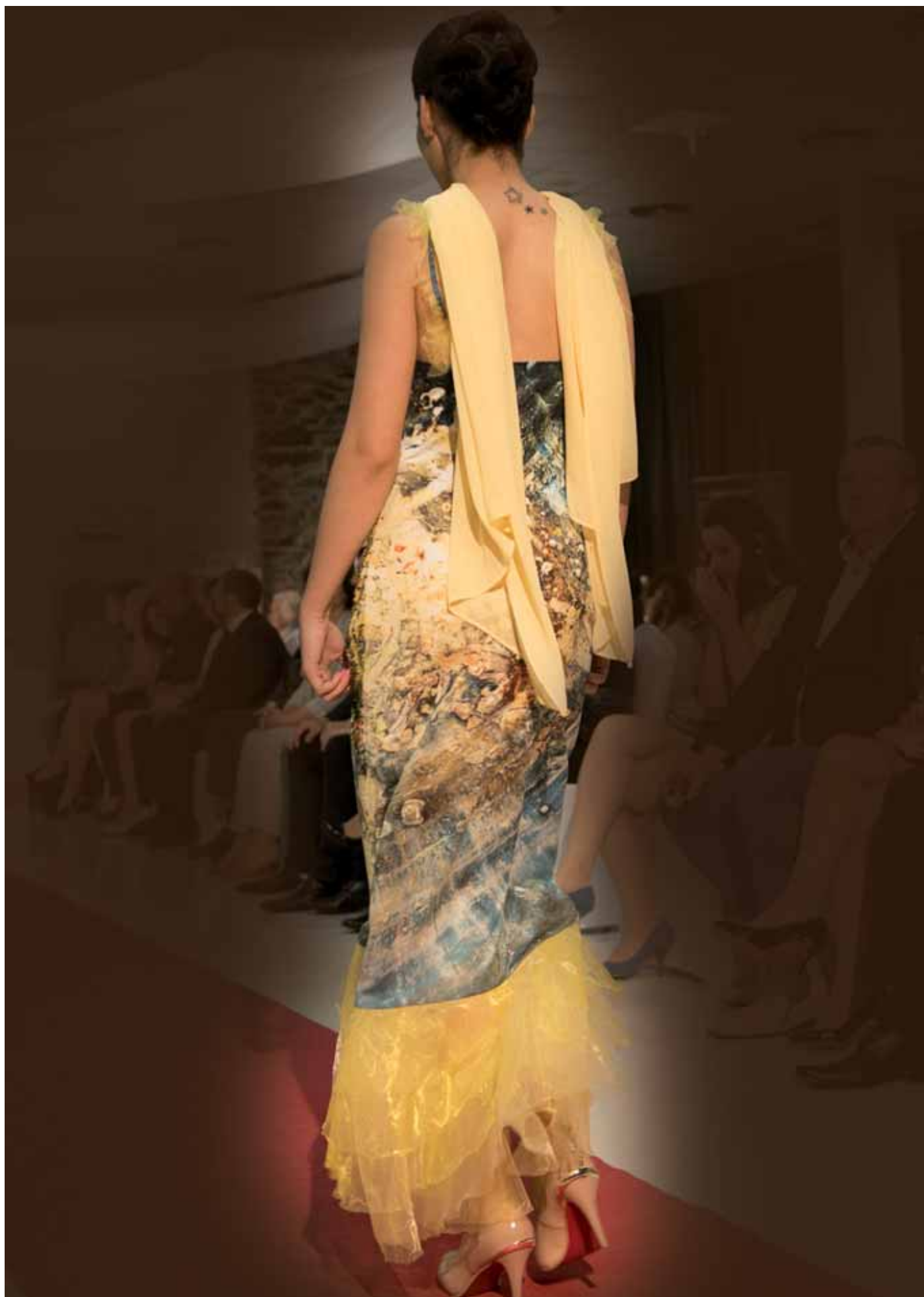
Vesmírná láska - šaty zdobené korálky (ruční výšivka) - módní přehlídka Zámek Víglaš, květen 2015