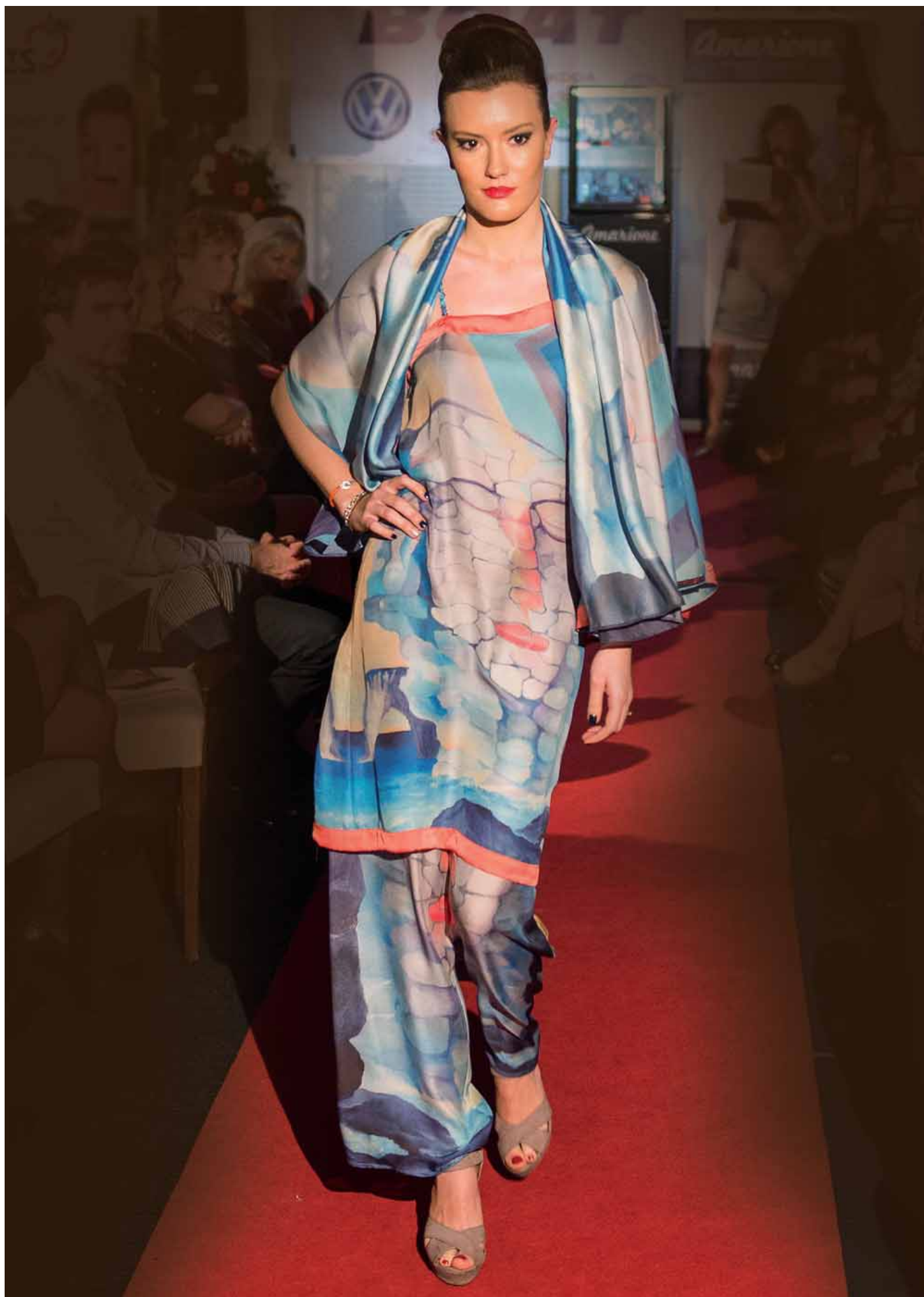
Kamenná láska v Normandii - kalhoty, asymetrické šaty a šála - módní přehlídka Bratislava, leden 2015