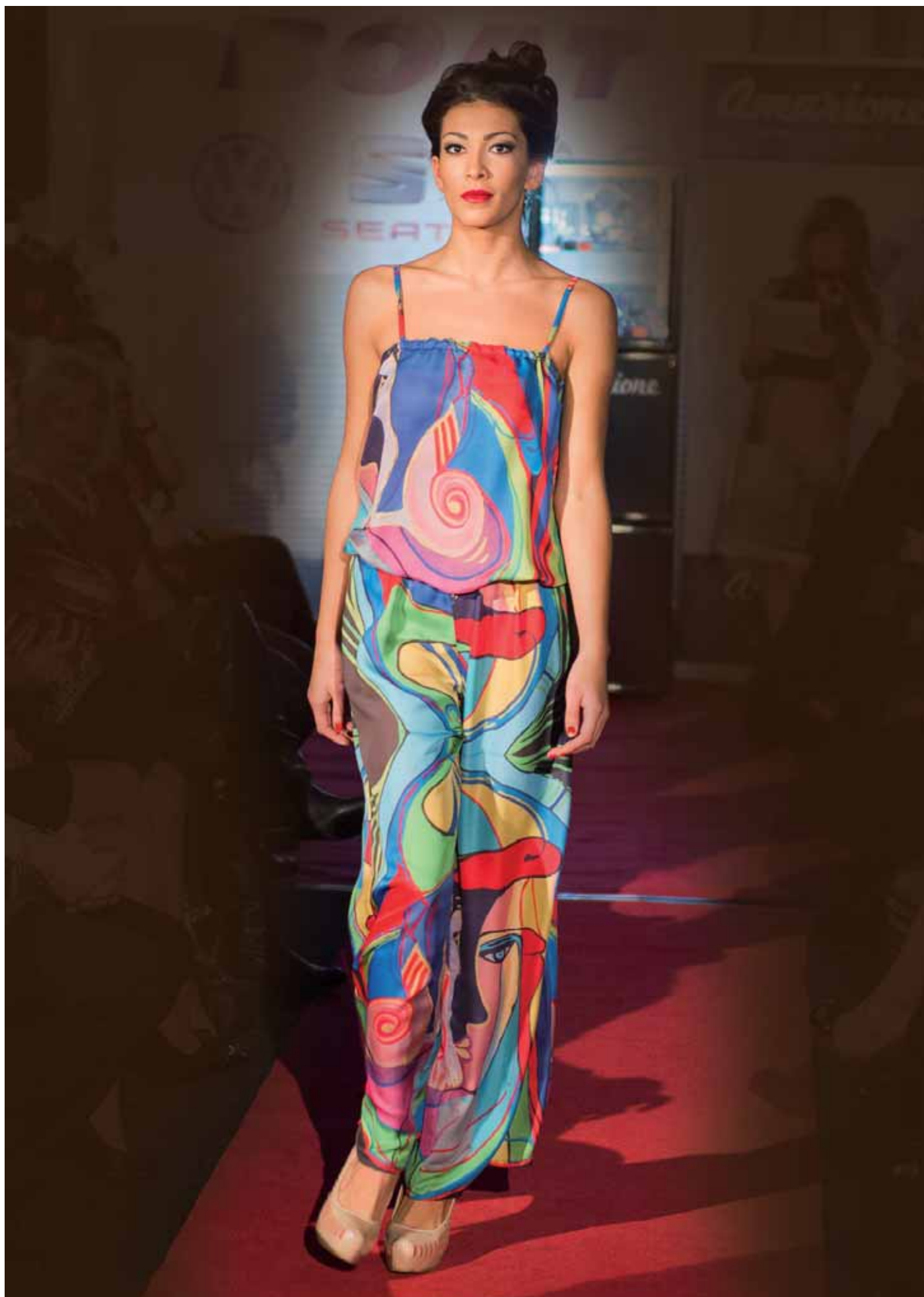
Šepot mušle - overal - módní přehlídka Bratislava, leden 2015