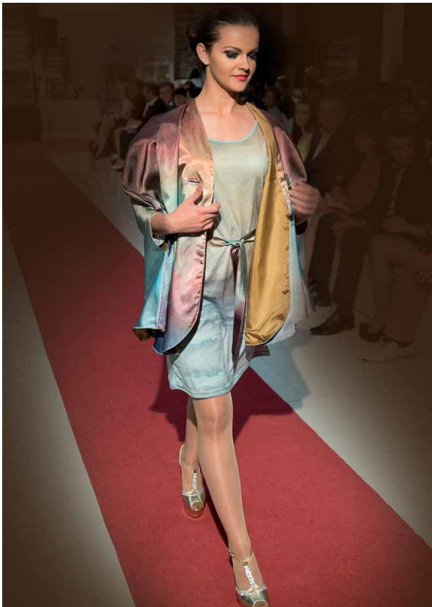
Měsíc a moře - šaty a paleta - módní přehlídka Zámek Víglaš, květen 2015