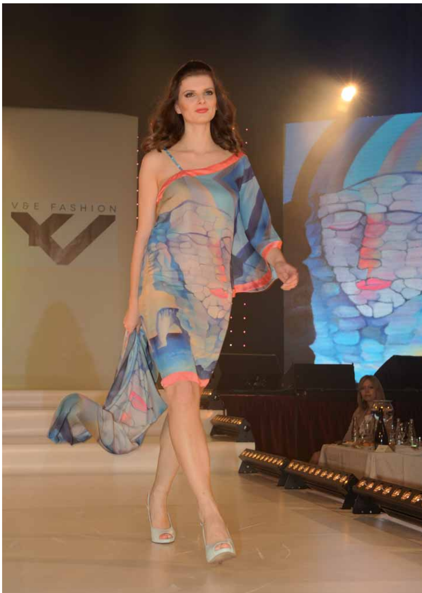
Kamenná láska v Normandii - asymetrické šaty, šála - módní přehlídka Trenčianske Teplice, duben 2015