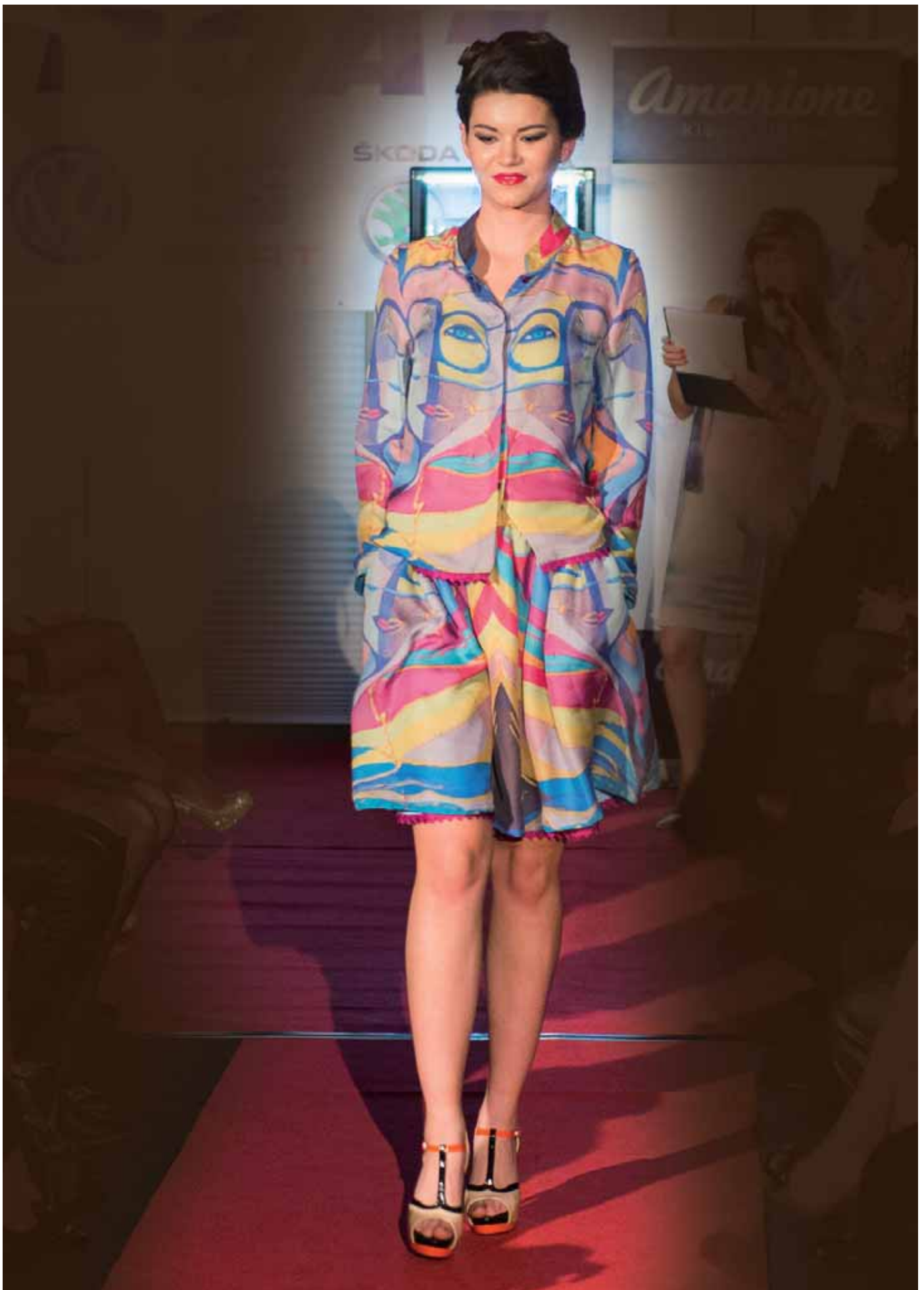
Houpání na vlnách - košile a sukně s kapsami zakončené krajkou - módní přehlídka Bratislava, leden 2015