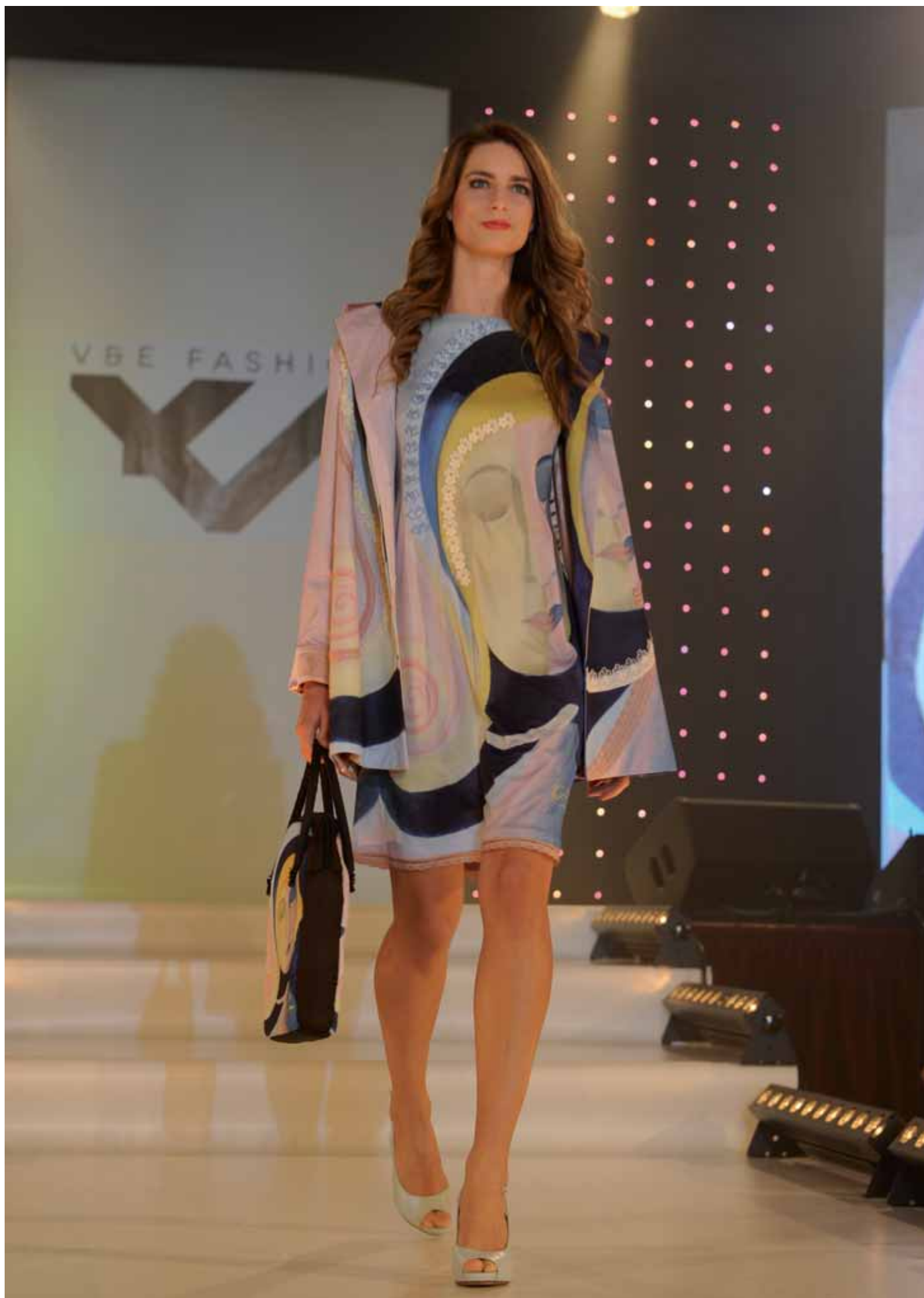
Dívka a její šťastný slon - šaty, kabát a kabelka - módní přehlídka Trenčianske Teplice, duben 2015