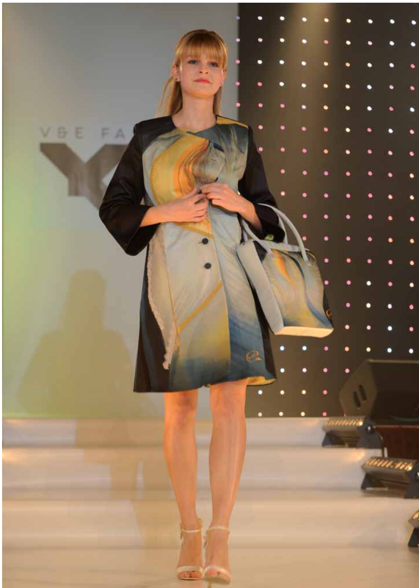
Anděl v hlavě - kabát a kabelka - módní přehlídka Trenčianske Teplice, duben 2015