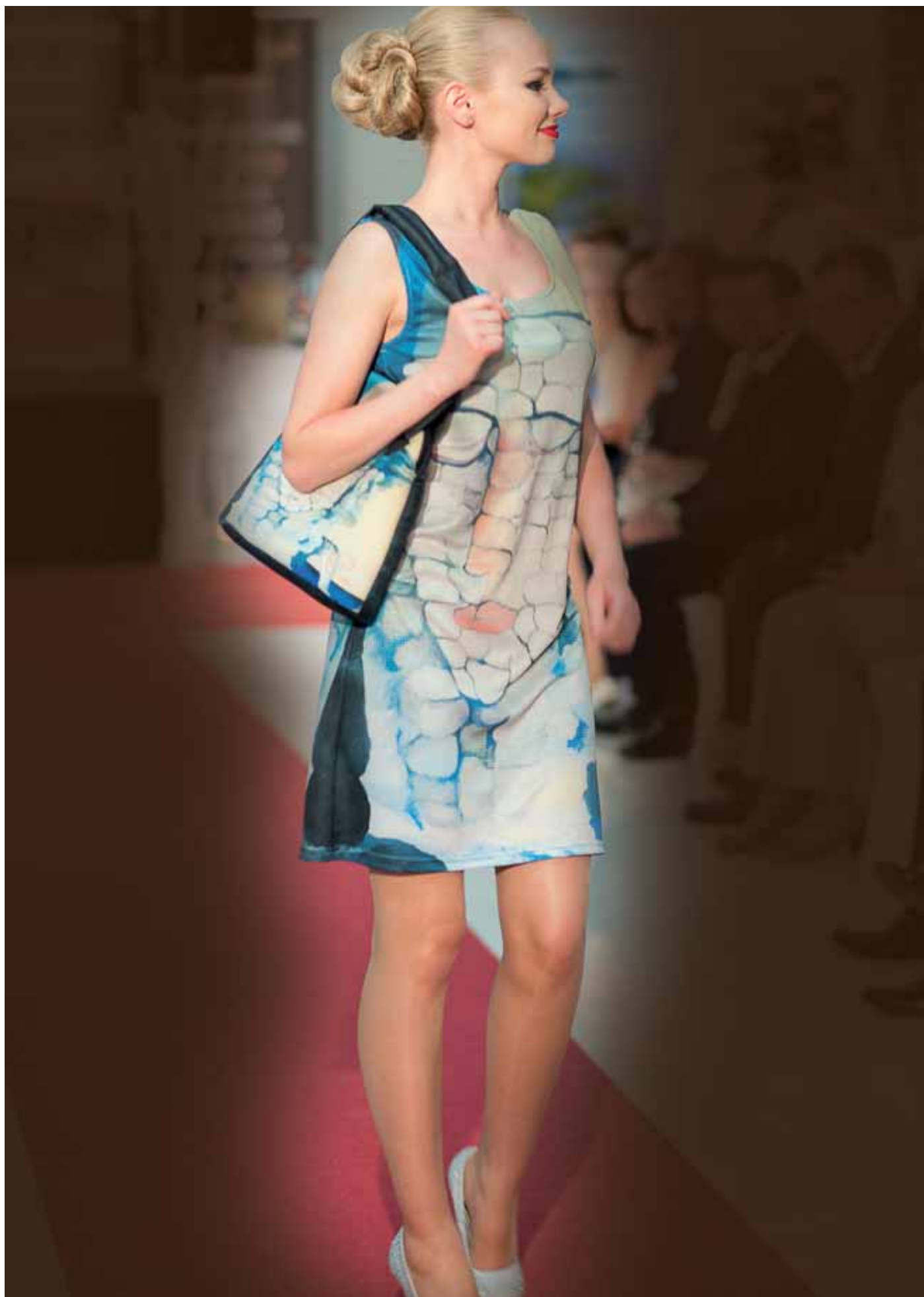
Kamenná láska v Normandii - lehké šaty a kabelka - módní přehlídka Zámek Viglaš, květen 2015