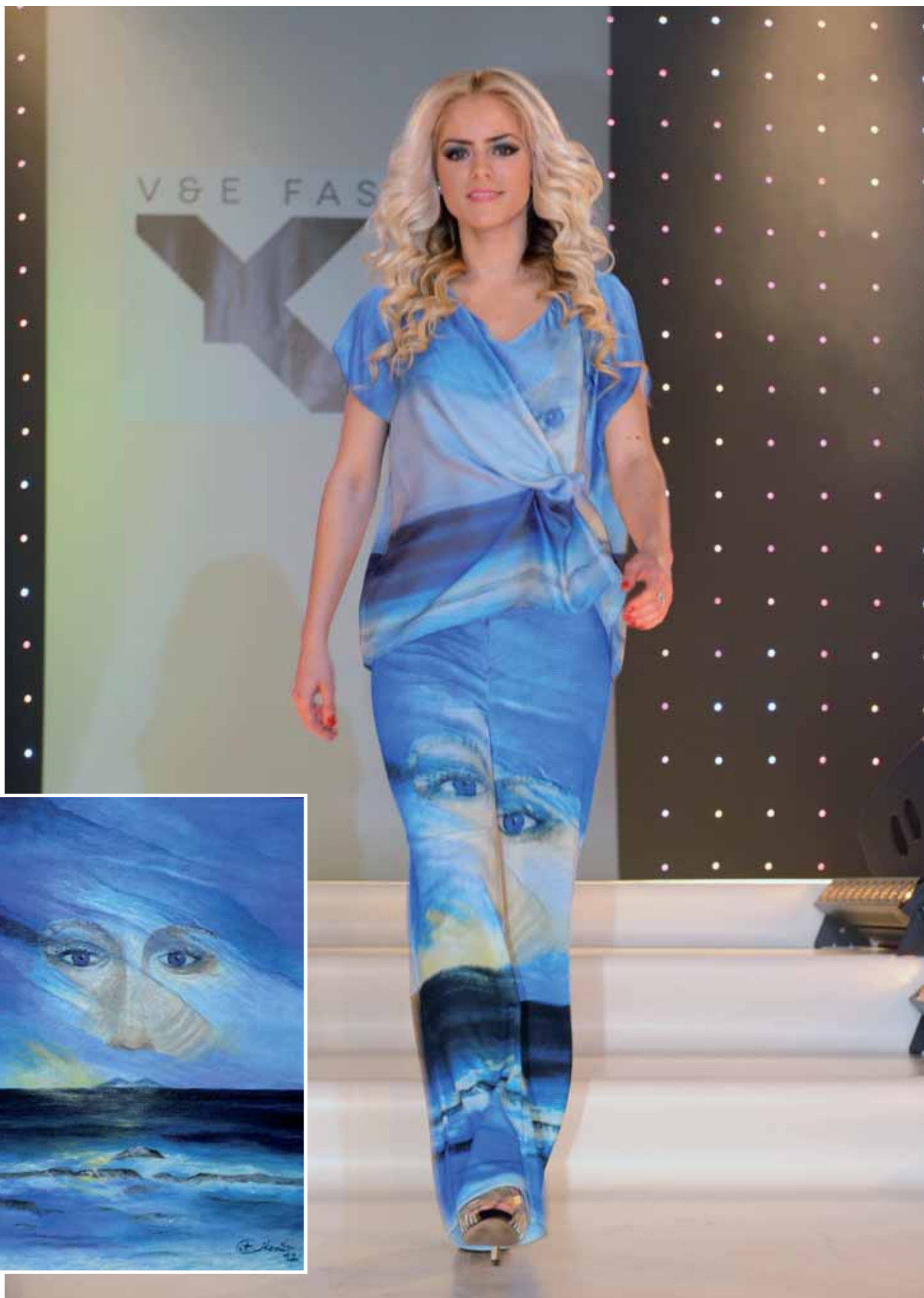
Mořské mámení - top a kalhoty - módní přehlídka Trenčianske Teplice, duben 2015