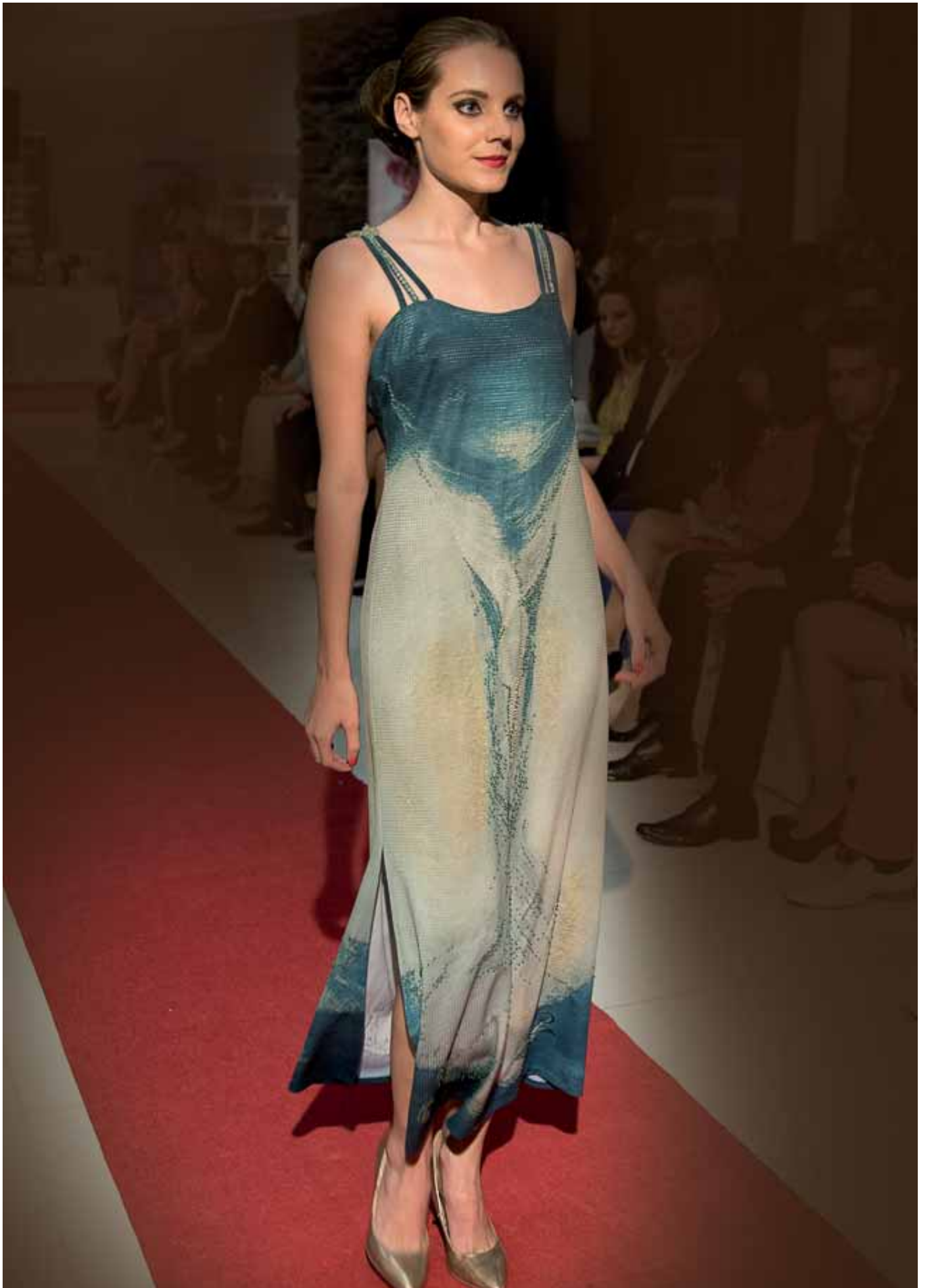
Anděl - šaty s ruční korálkovou výšivkou - módní přehlídka Zámek Víglaš, květen 2015